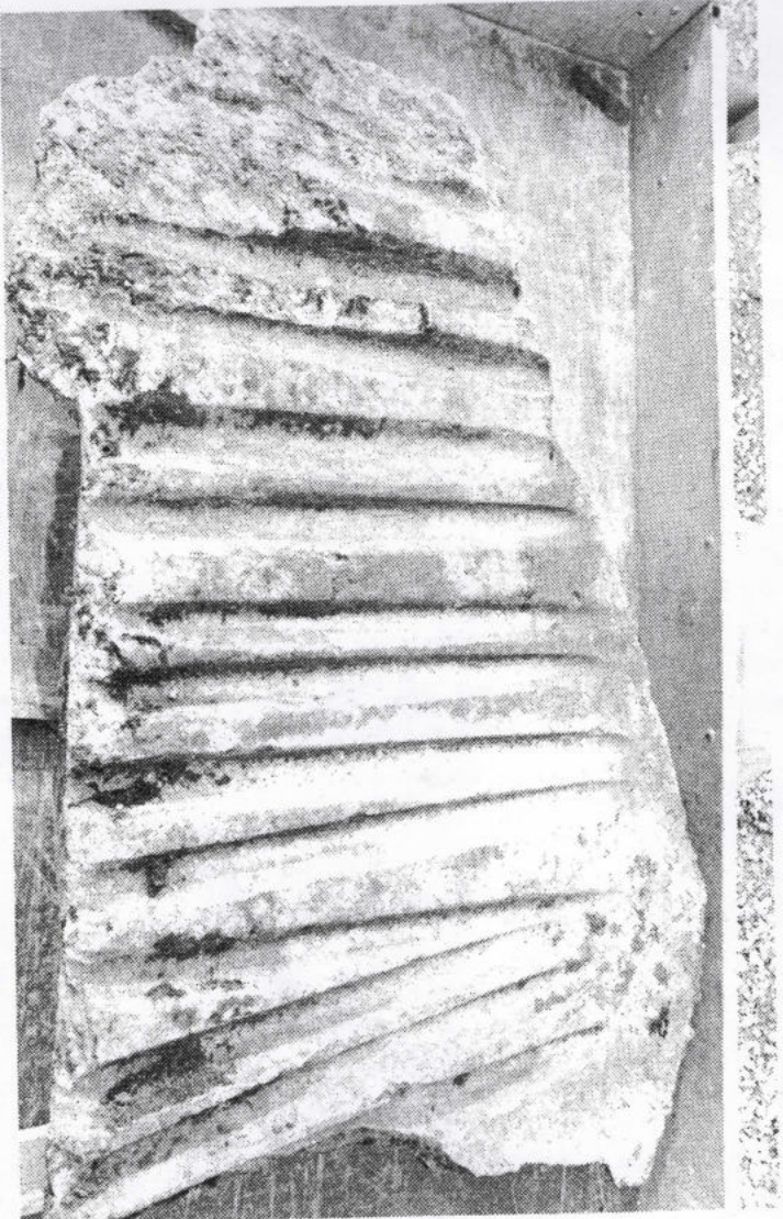
Så gott som hela stenens yta täcks av slipskåror. Kan de ha funnits där redan när bildstenen högs till?

Den fulla höjden är drygt två meter. Övre, högra delen av stenen har slagits av och finns inte kvar. Basen, den nedre delen av stenen, är