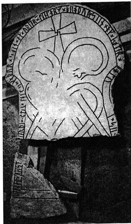
G 309. Foto: Helmer Gustavson 1983.