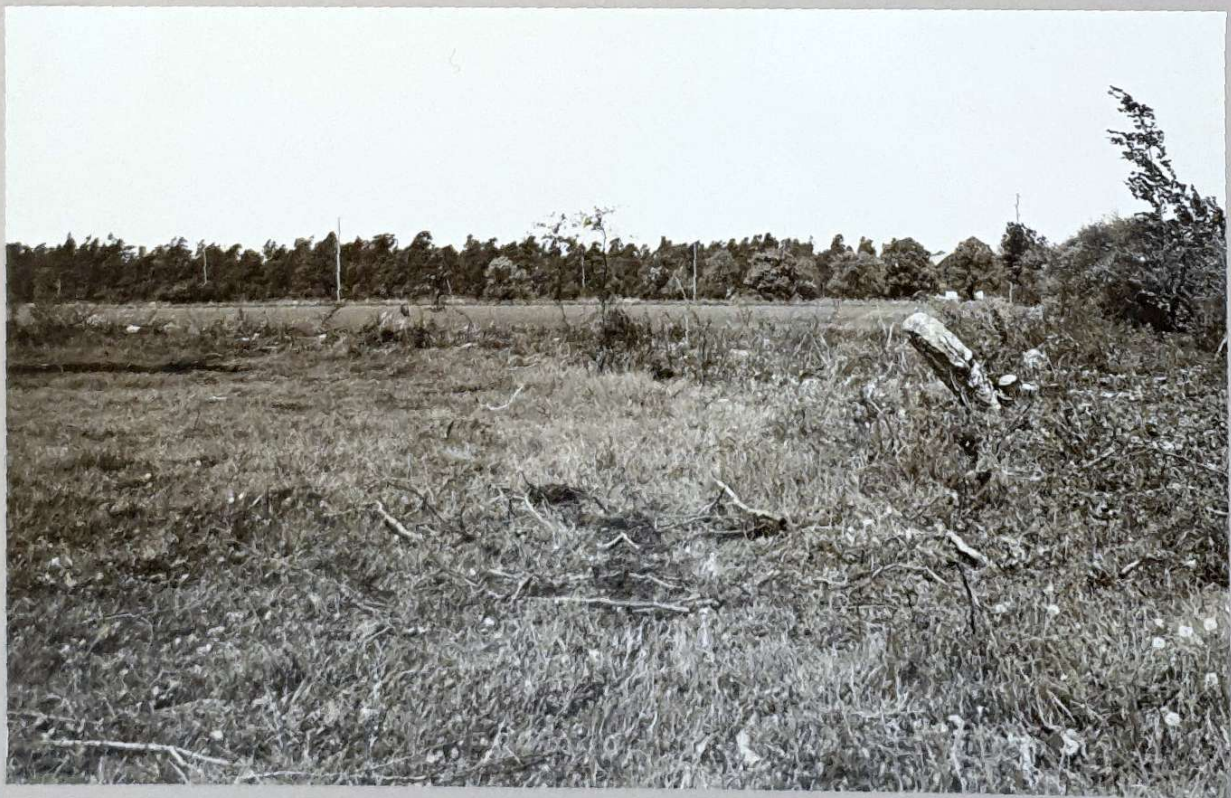
Bildsten från SSÖ.