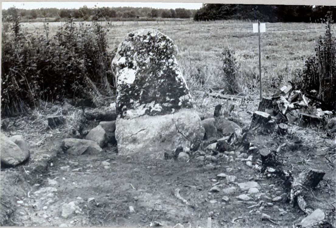
bildstenen från nÖrr.