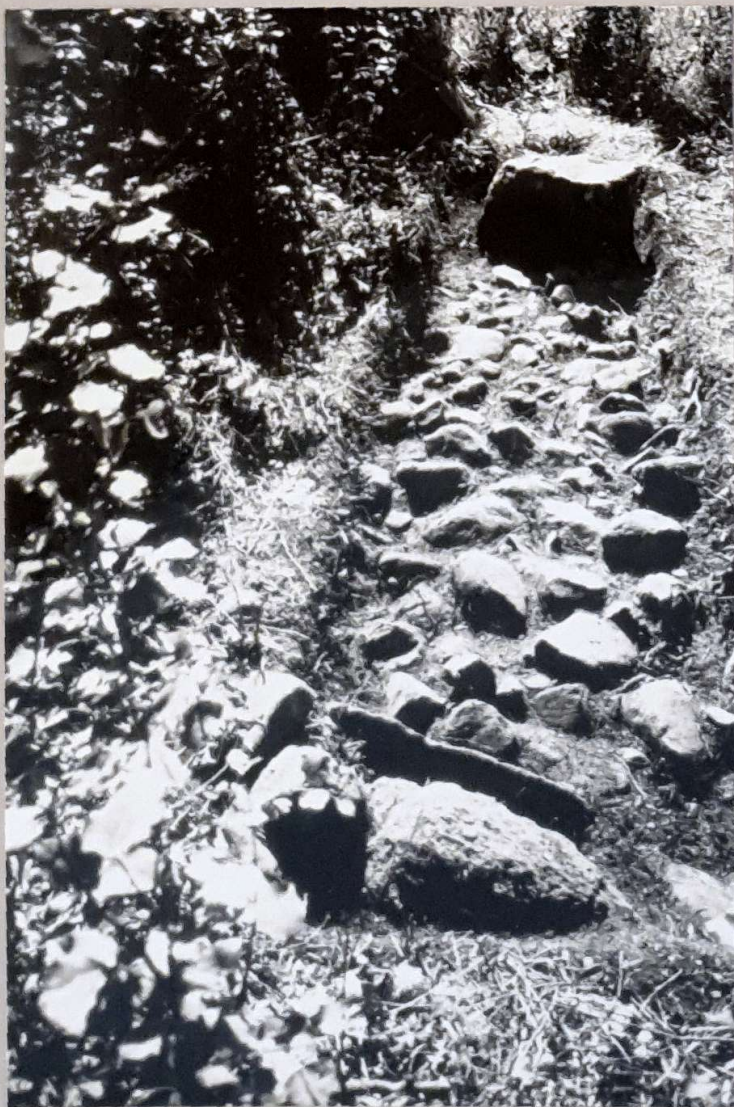
Neg nr XXXXIII:352 (färgdiaoriginal) Foto Karl-G Måhl. Schakt II från söder. Vägens fundament av 0,2 -o,4m st stenar samt kant- skoning av större, intill medelstora gråstenar.