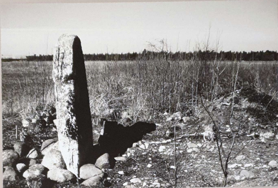
Neg nr XXXXIII:351 (färgdiaoriginal)

Bildstenen åter i rest läge, från öster.